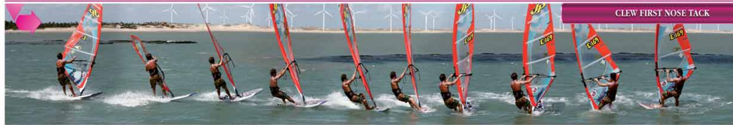
CLEW FIRST NOSE TACK