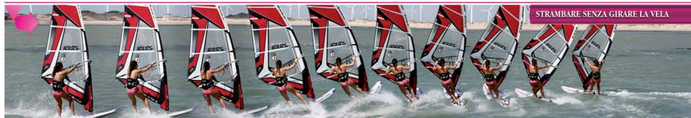
STRAMBARE SENZA GIRARE LA VELA