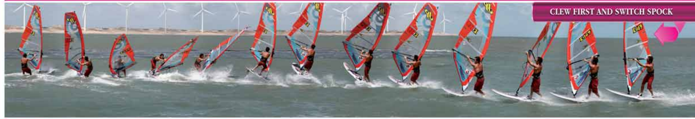
CLEW FIRST AND SWITCH SPOCK