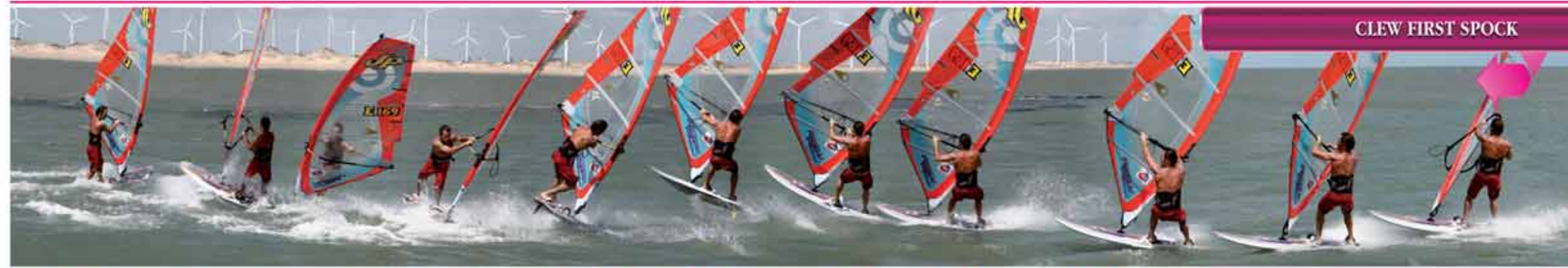
CLEW FIRST SPOCK