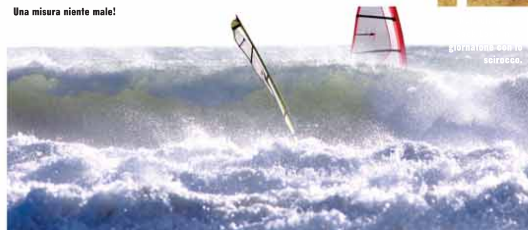
giornata con lo scirocco.