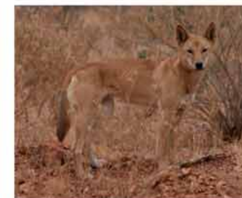
Animali australiani: il canguro, il dingo e i delfini.