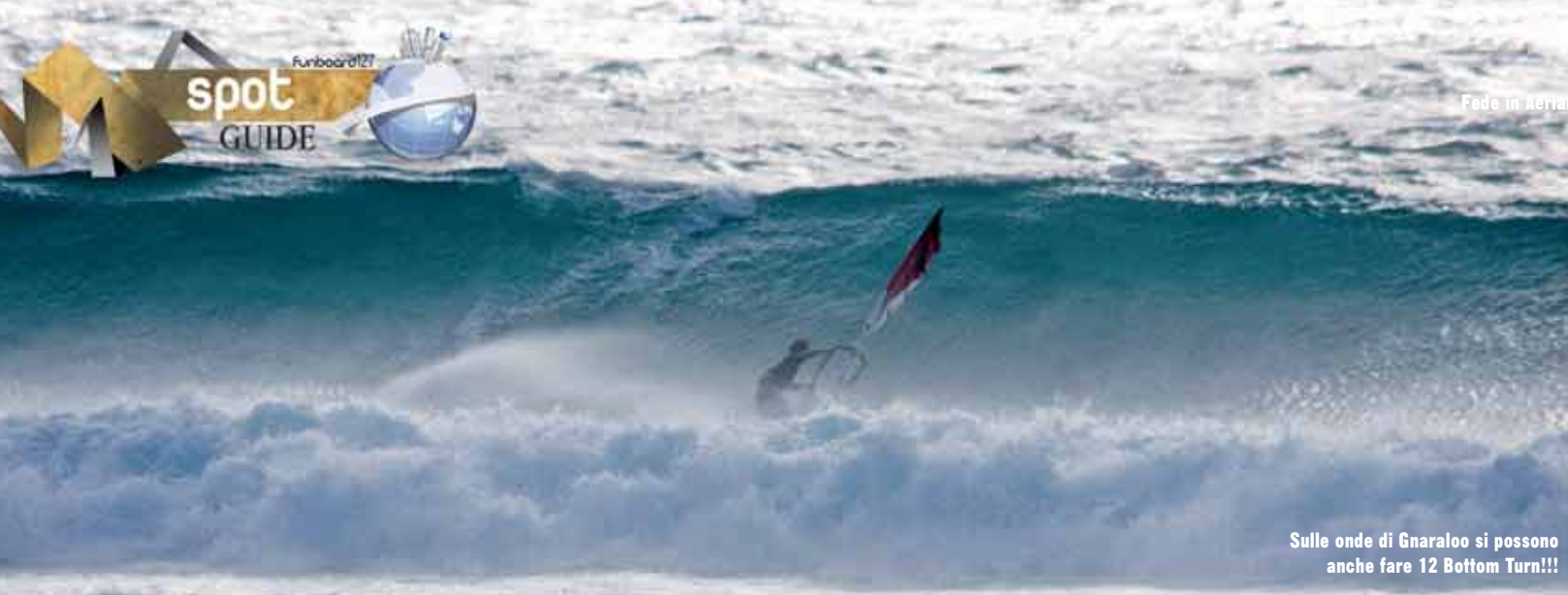
Sulle onde di Gnaraloo si possono anche fare 12 Bottom Turn!!!